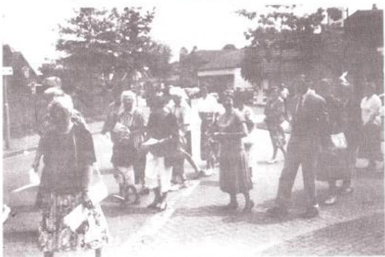
Een aantal deelnemers aan de processie in 1963 (boven) en 1993 (onder). Een opvallend verschil: in 1963 liep iedereen keurig achter elkaar aan weerszijden van de straat, in het midden ruimte openlatend voor de vaandeldragers. Tegenwoordig loopt men wat ongedwongener mee.