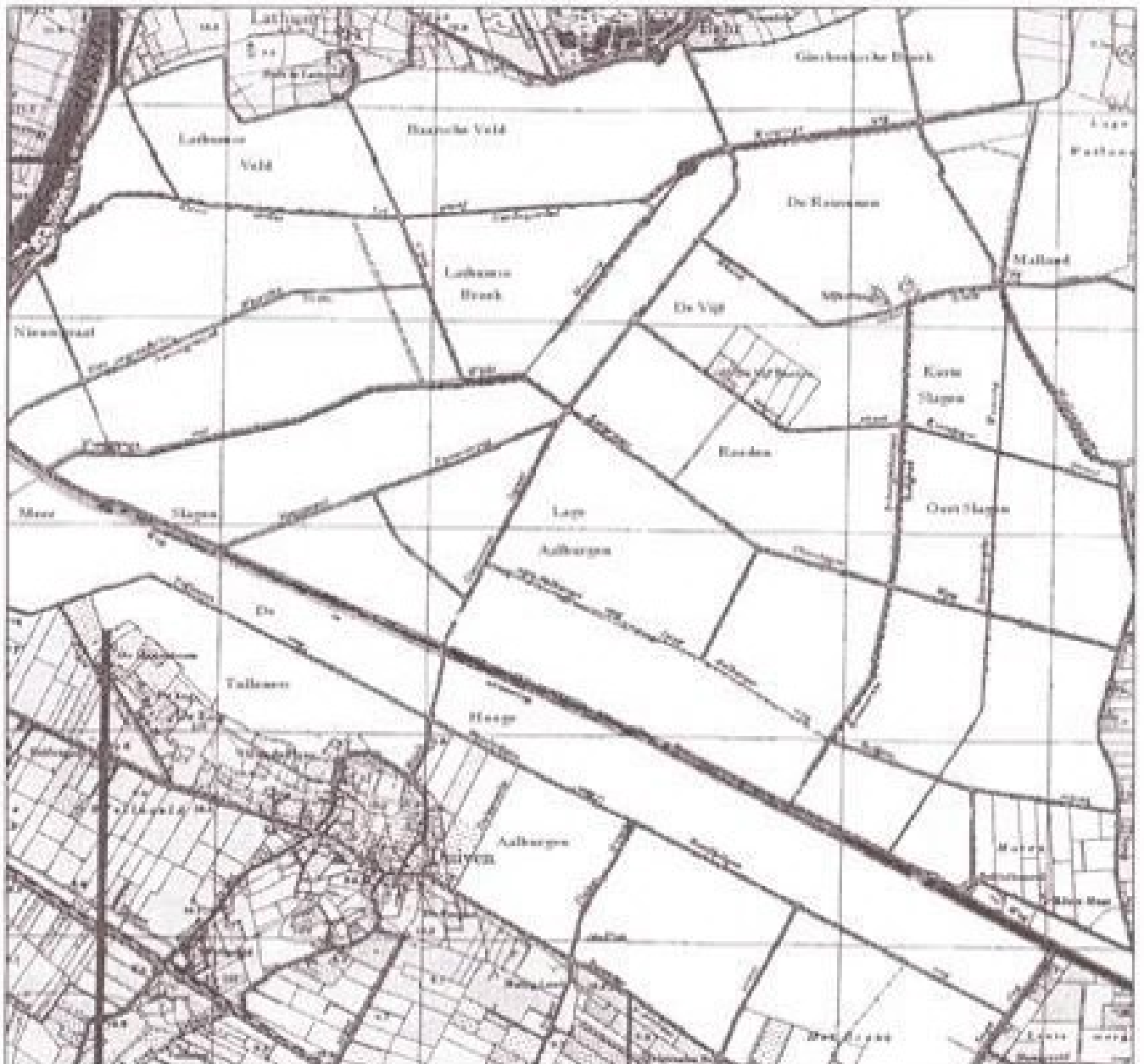
Het Duivense Broek na de voltooiing van de ruilverkaveling (1953-1954). De A12 is vrijwel gereed, nieuwe wegen en waterlopen zijn aangelegd.

volgende neer. Het zou niet alleen een belangrijk object van werkverschaffing vormen, maar tevens zou zij door de mogelijkheid van omzetting van grasland tot bouwland, hetgeen arbeidsintensiverend werkte, een blijvende werkverruiming ten gevolge hebben. De hierdoor ontstane verhoging van productiviteit van de grond was vooral in deze tijd van niet te onderschatten betekenis. In dit verband werd nog