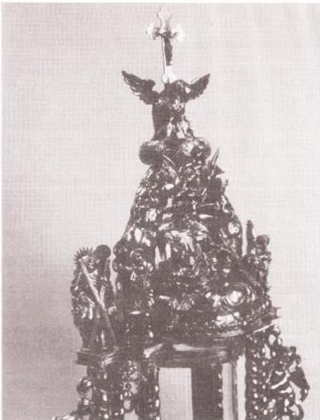
Groessense monstrans, detail met de apostel Andreas

die verder uitsluitel kunnen geven wanneer de Groessense kerk in het bezit kwam van deze prachtige monstrans.