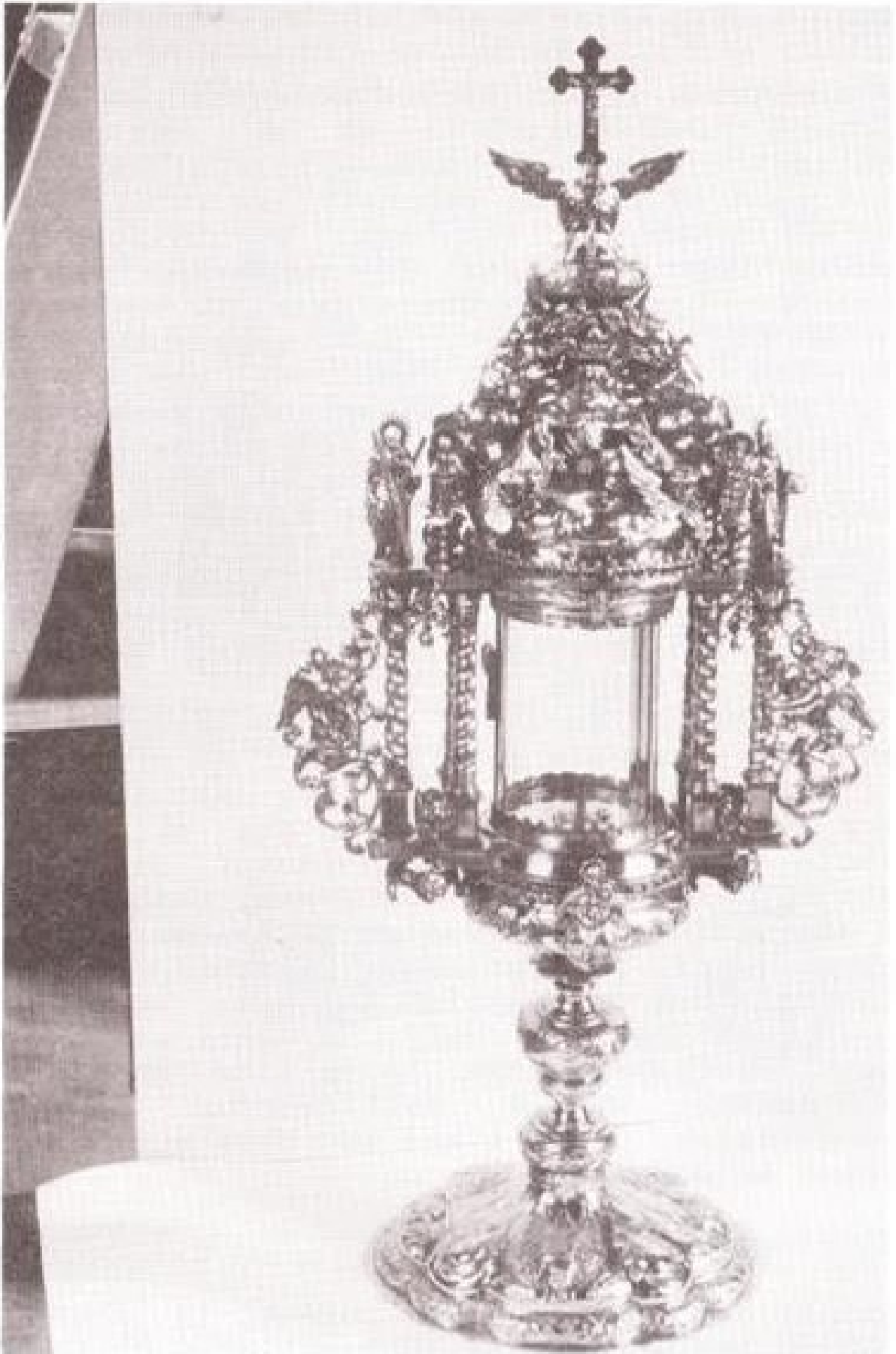
Groessense monstrans