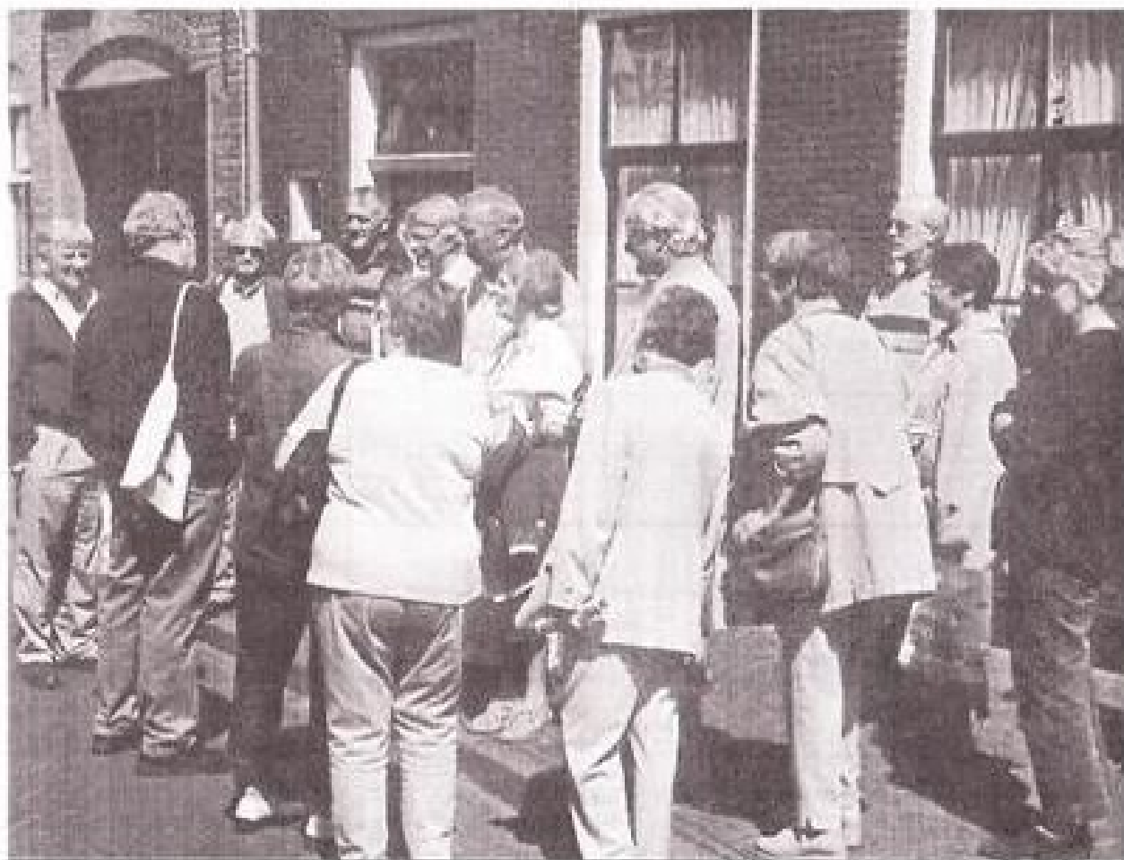
9 Juni 2001, de gids van de Hattemse VVV in gesprek met het gezelschap uit de gemeente Duiven.

dan ook die musea te gaan bekijken. Tenslotte is het per auto maar 50 minuten rijden en ook met trein en bus kun je er komen. In elk geval was de tocht naar Hattem geslaagd!