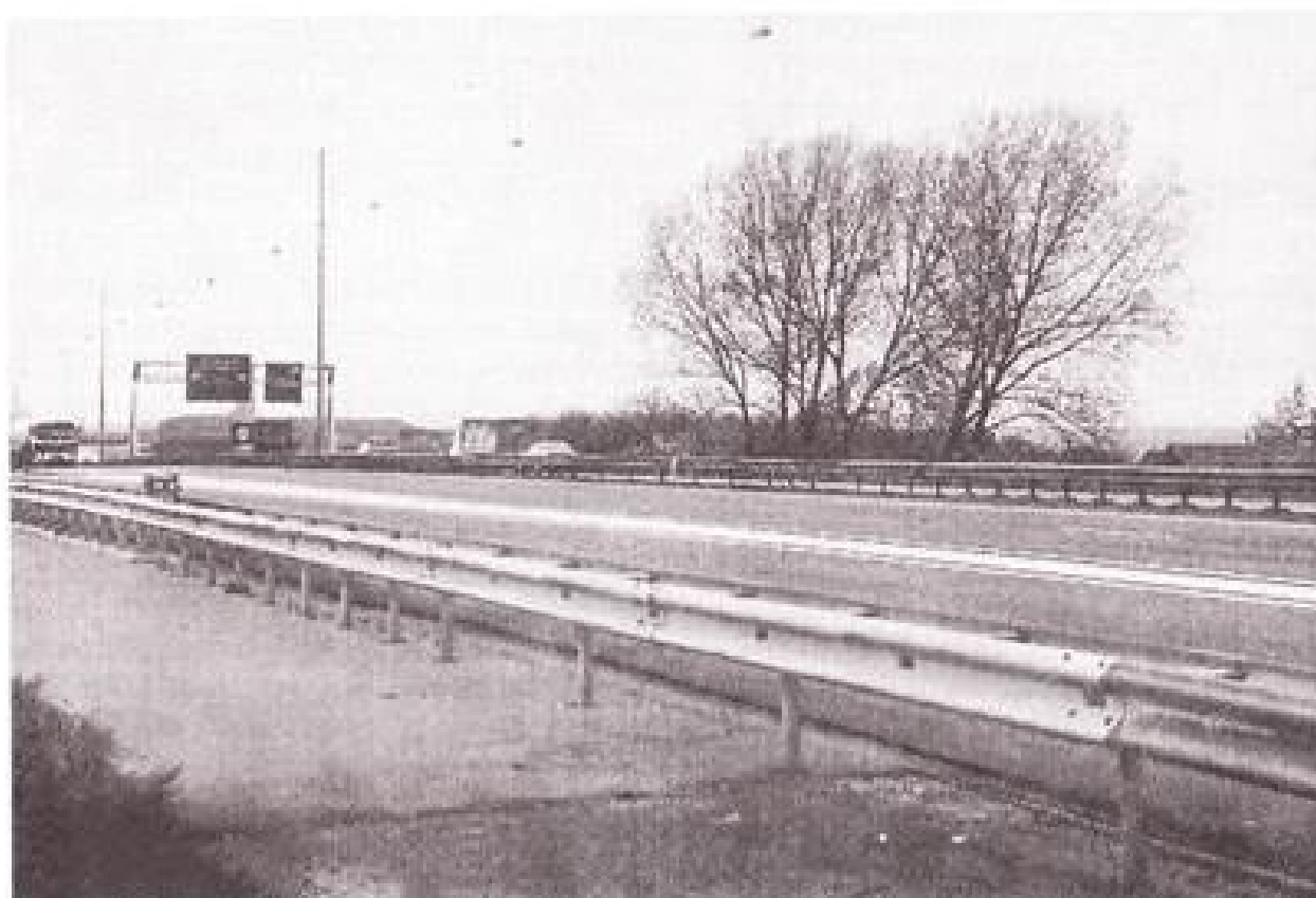
Verbreiding viaduct over Giesbeeksestraat, 12 mei 1992 (HK/J 017-15).

Een grote wens van beide genoemde wethouders werd nog geuit, namelijk een oprit voor het gezamenlijke industrieterrein Hengelder aan de zuidkant van rijksweg A12.