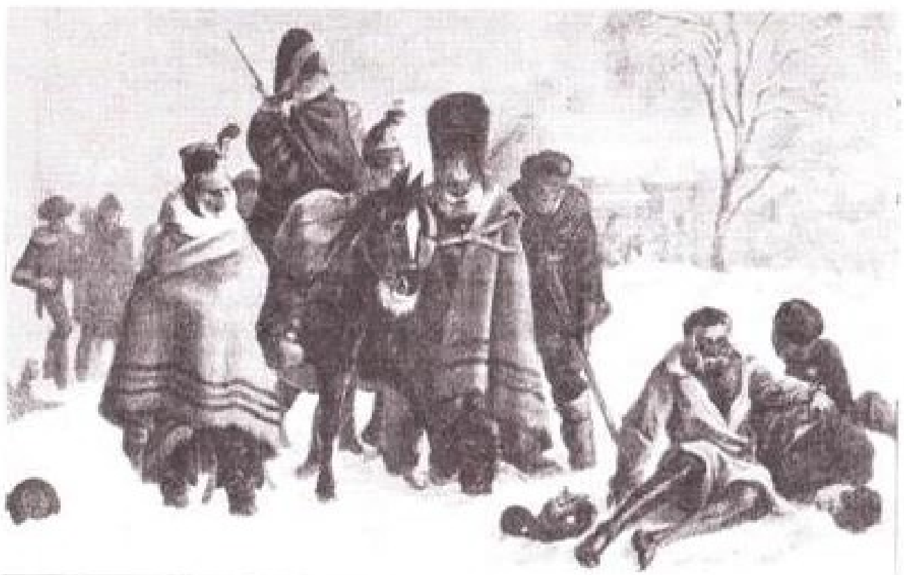
Teregtocht uit Rusland van soldaten uit Napoleon's leger (1812)

cepteerd. Wanneer met een plaatsvervanger een akkoord was bereikt, werd daarvan door een notaris een contract opgemaakt met de wederzijdse verplichtingen van beide partijen. Er kon bijvoorbeeld in staan dat de plaatsvervanger telkens een bewijs moest leveren van zijn aanwezigheid in dienstverband, al of niet gekoppeld aan een periodieke uitbetaling. De contracten waren derhalve heel verschillend. De belangrijkste bepaling was wel om aan de remplaçant zelf of aan zijn nabestaanden een aanzienlijke bedrag uit te keren als hij tijdens zijn militaire dienst verwond raakte of om het leven kwam.