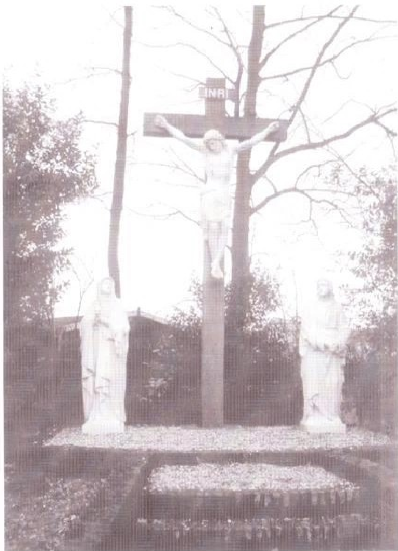
De Calvariagroep, ontworpen en vervaardigd door Gerard Lissen uit Venlo, aan de Broekstraat dat destijds werd gezien als een scheidingslijn van Oud- en Nieuw-Duiven (foto: A.W.A. Bruins, 2003).