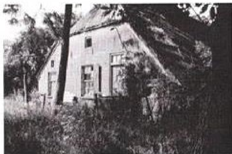
Foto 2 De achterzijde van de boerderij in 1993.