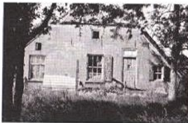
Foto 1. De Boerderij - voorzijde in 1993.