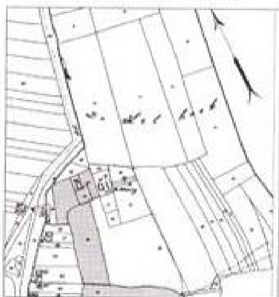
Kaart 3 Fragment van kaart sectie B, blad 1 (1832). Vele percelen hebben dezelfde vorm als in 1735 en in 1810.